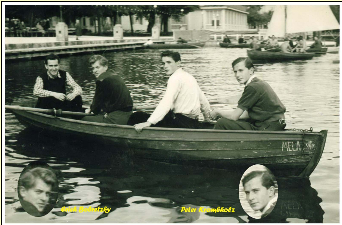
ÖGB-Jugendheim Velden/Wörthersee 1954

Ich habe Erich als einen wirklich guten und liebenswerten Freund aus den Kindheit und Jugendtagen in bester Erinnerung.