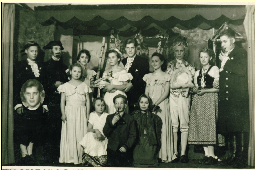
Kinder- und Jugendgruppe der Laienspielgruppe "Bohemia"